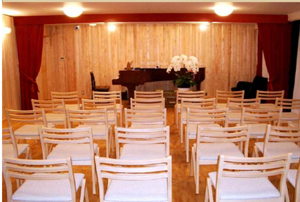
客席から見たステージ

オープン以来、ピアノ発表会、声楽発表 会、コーラス定期演奏会、コーラスレッ スン、邦楽演奏会、日舞お稽古会など の音楽イベントや、絵画、写真、陶芸な どの個展や作品展のギャラリーとして、 また、お祝い事、クリスマスパーティ、 忘年会、新年会等の各種催し物にもご 利用およびお問い合わせをいただいで おります。